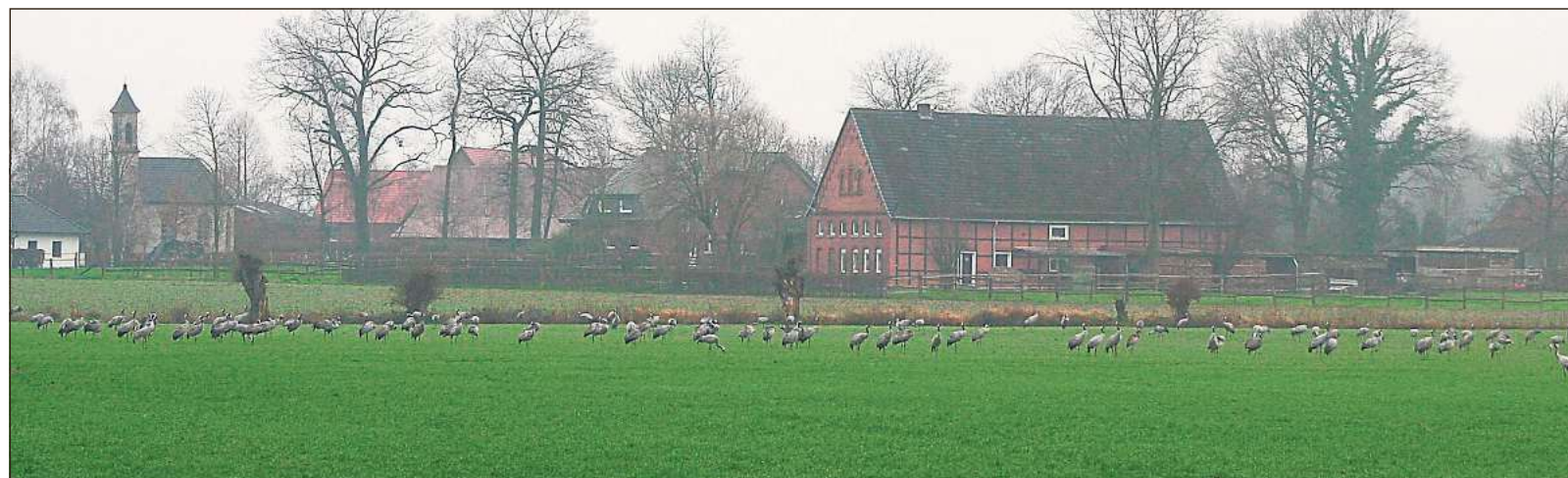
Eine große Zahl an Kranichen hat „Glocke“-Leserin Brigitte Wiesner am Schürenbrink in Ostenfelde entdeckt. Im Hintergrund zu sehen ist die Schürenbrink-Kapelle.